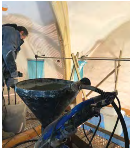
Anmischen des DESOI AnchorNox® Trockenmörtels vor der Injektion der Ankerstangen