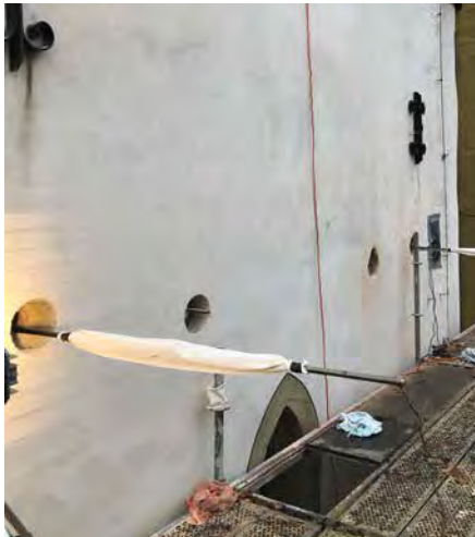
Wegen wertvoller Wandmalereien durften die Strumpfanke nicht durch den Innenraum der Kirche eingebracht werden.