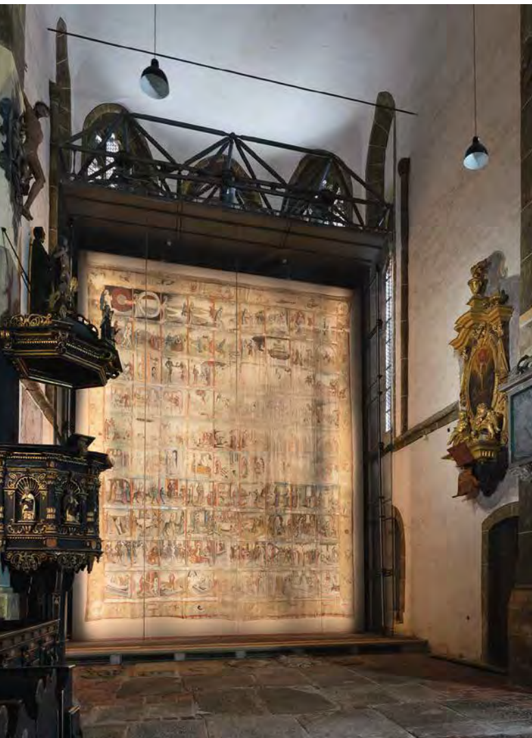
Großes Zittauer Fastentuch

Das Gebäude der Kirche ist ein verputzter Bruchsteinbau mit zwei Strebe-pfeilern an der Westseite und je einem an der Nord- und Südseite, hohen Spitzbogenfenstern und einem Satteldach, auf dem ein Dachreiter mit Haube und sehr schlanker Spitze sitzt. 1793 wurde eine Decke aus Gips im Chor eingezogen. An der Chornordwand schließt sich die Sakristei an, die an der Westseite in der Ecke zum Schiff einen kleinen Treppenturm hat.